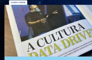
Entrevista para o jornal OVALE