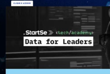
Curso Data For Leaders na Startse